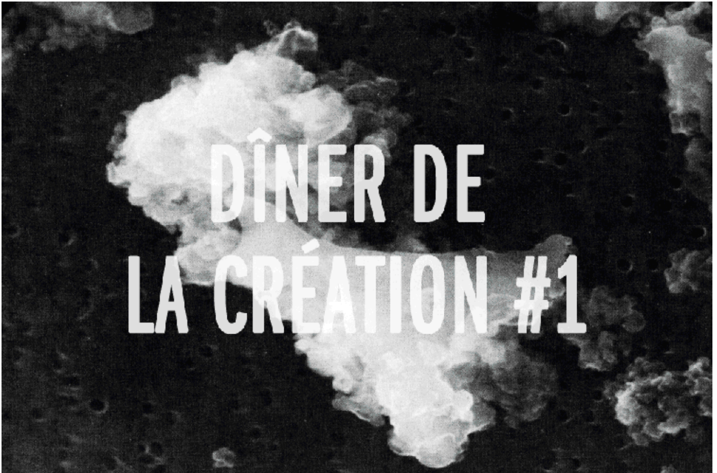
Image from the Cosmic Dust Catalogue 1982, Vol 1, n. 2, NASA Johnson Space Center, Tomás Saraceno